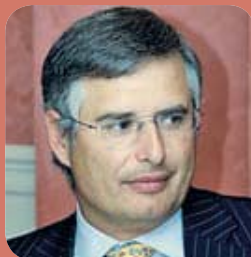
Carmelo Sanz, presidente de Federación Española de Empresas de Tecnología Sanitaria (Fenin).

El jurado encargado de decidir quiénes son los ganadores de los Premios Sanitaria 2000 a la Sanidad de Castilla-La Mancha está compuesto por 12 importantes personalidades del ámbito sanitario de nuestro país