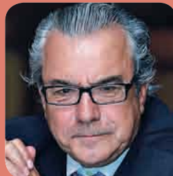
➤ Avelino Ferrero, presidente de la Federación de Asociaciones Científico Médicas de España.