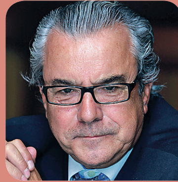
➤ Avelino Ferrero , presidente de la Federación de Asociaciones Científico Médicas de España.