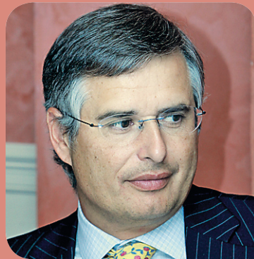
➤ Carmelo Sanz , presidente de Federación Española de Empresas de Tecnología Sanitaria (Fenin).

➤ El jurado encargado de decidir quiénes son los ganadores de los Premios Sanitaria 2000 a la Sanidad Castilla y León está compuesto por 12 importantes personalidades del ámbito sanitario de nuestro país.